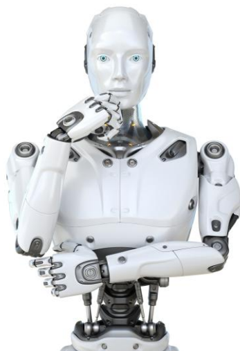
((_Bild_4_Junker Schleiftechnik für Humanoide Roboter Komponenten.jpg))

Das serverbasierte System zur digitalen Produktionssteuerung liefert unter anderem Schritt-für-Schritt-Anweisungen für das Bedienpersonal, damit die Abläufe direkt auf Antrieb passen.